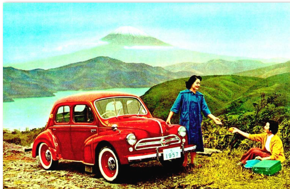
Hino Renault 4CU - 1958