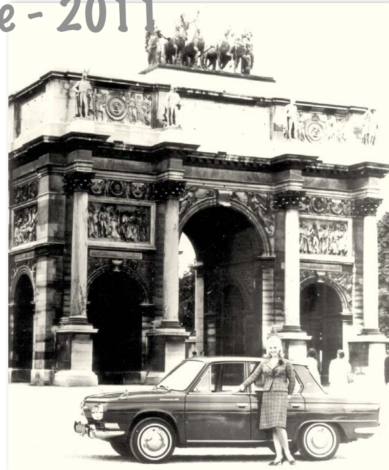
Hino Contessa 1300 - 1964 (Paris Salon)