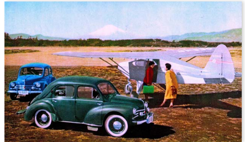
Chofu Airport with PA-22 Tri-Pacer & Mt. Fuji, Tokyo (調布飛行場)