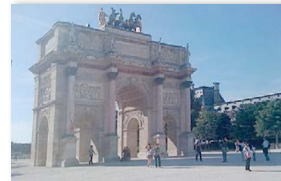
French Historical Landmark Arc de Triomphe de Carrousel, Paris