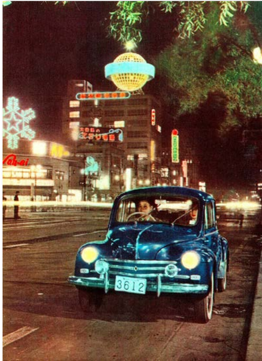
The Ginza, Tokyo (東京、銀座4丁目)

The Origin - Cultural Strategy by Regie National Des Usines RENAULT