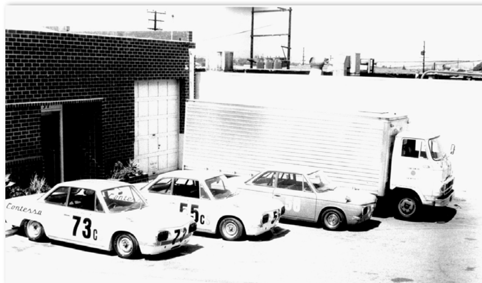
Hino Contessa 1300 Coupe C - 1967