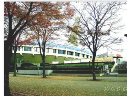
Japanese Memorial Landmark Yoyogi National Stadium in 1964 Tokyo Olympic Games

1964年東京オリンピック、 体操の競技場、東京、 現代々木国際スタジアム (第二体育館)