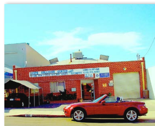
Race Car Builder's Landmark El Segundo, CA. U.S.A

レーシングカー製作者の聖地 米国カリフォルニア州 エル・セグンド市 (ロス国際空港近郊)