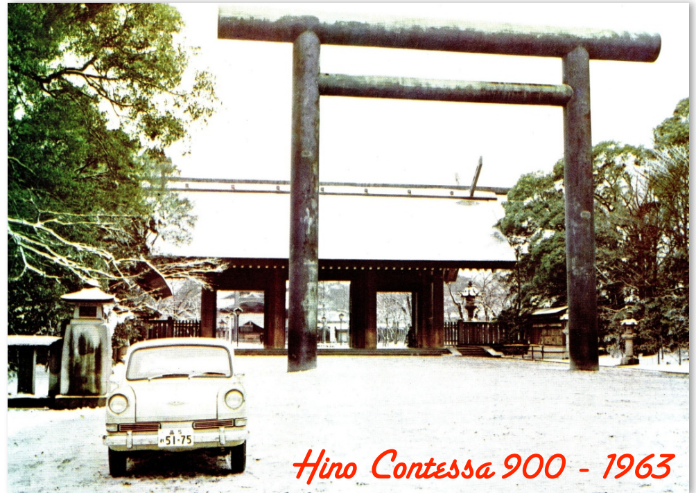
Hino Contessa 900 - 1963