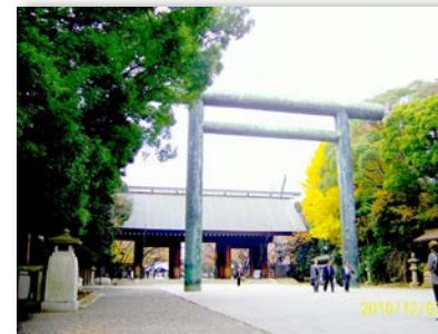
Japanese Historical Landmark Yasukuni Shrine, Tokyo