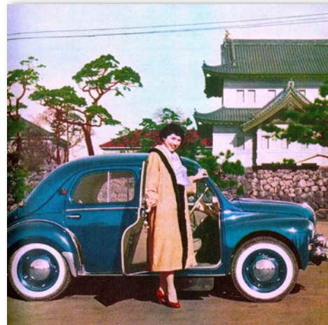
The Imperial Palace, Tokyo (皇居前)